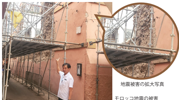
地震被害の拡大写真

みんなの幸せのモノサシに違いがあるかもしれませんが。しかし笑顔は皆同じです。みんなの笑顔が見たいから、わたしも笑顔で頑張ります。